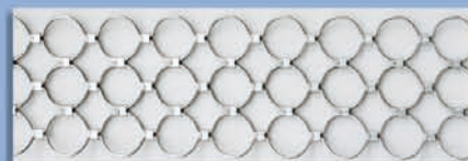
Varilla, aros y conchas - 8 mm.