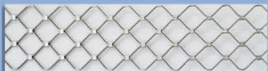
Varilla rombo - 8 mm. - 316 brillo